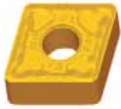
NEGATIVE 80° RHOMBIC